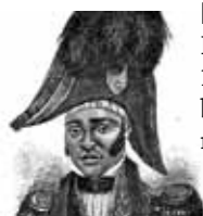
Jean-Jaques Dessalines (1758–1806) erklærte Haitis uavhengighet i 1804.

Eksepsjonell kulturarv. Det er historien som har definert Haitis særegenhet, landet hvis nasjonaldag samsvarer med dagen i 1804 da slaveriet ble avskaffet og verdens første «svarte republikk» ble født. I Haiti virker hukommelsen rundt det som skjedde som noe samlende, og kanskje er denne delen av historien også den eneste fellesnevneren i et vertikaldelt samfunnssystem, hvor folk tilhører ulike kaster. I alle samfunnslag gir minnet om slavens motstand en følelse av identitet og av å tilhøre det samme historiske fellesskapet. Men dette minnet er selektivt, noe som henger sammen med den haitiske revolusjonen og uavhengigheten, men som samtidig visker bort tiden da Haiti var en koloni og det som skjedde siden, etter revolusjonen.