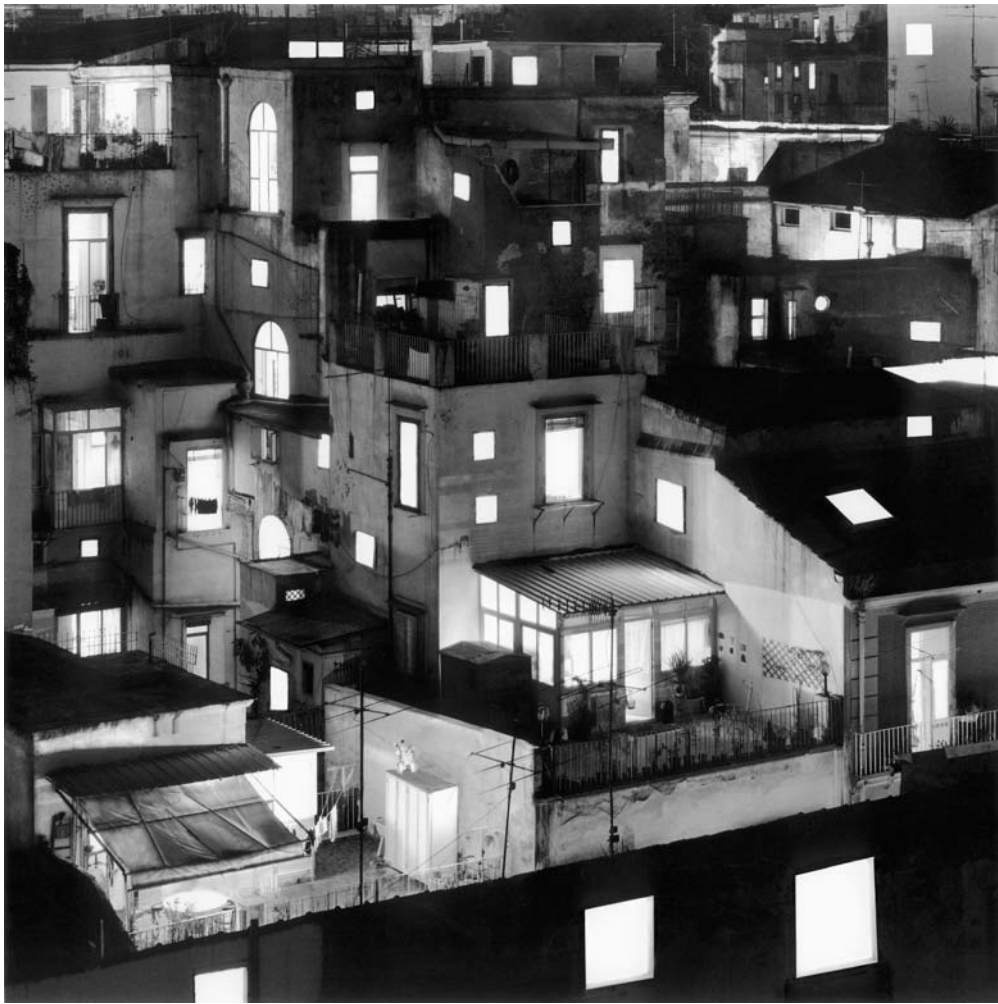
graphisme Francesco Armiti / Solimena - Raffaele Marmello - Napoli. Quartieri spagnoli, 2001 - Collezione Cotroneo