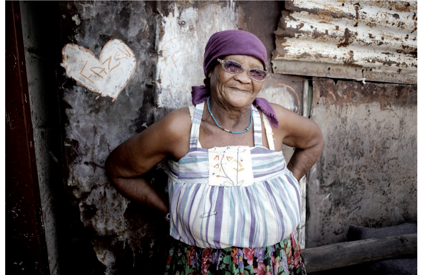
HANNA, KHOMANI COMMUNITY, UPINGTON, 2009