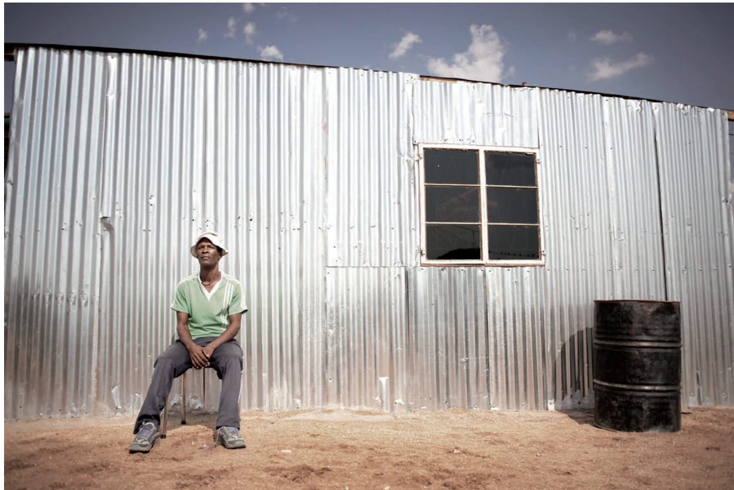
ABRHAM, KHOMANI COMMUNITY, UPINGTON, 2009

Te considères-tu comme un « documentariste itinérant », ou as-tu un but précis, fixé sur la ligne d’horizon, avec une idée claire du rôle de la photographie ?